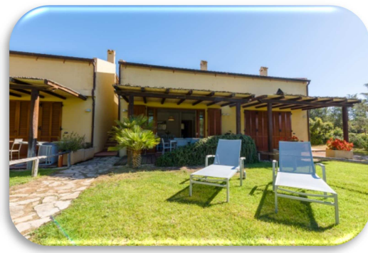
Ville I ginepri sul golf