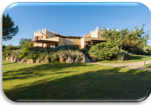
Foresteria La Colonna