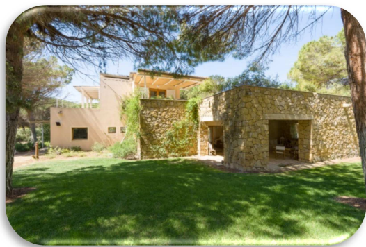
Foresteria degli ulivi